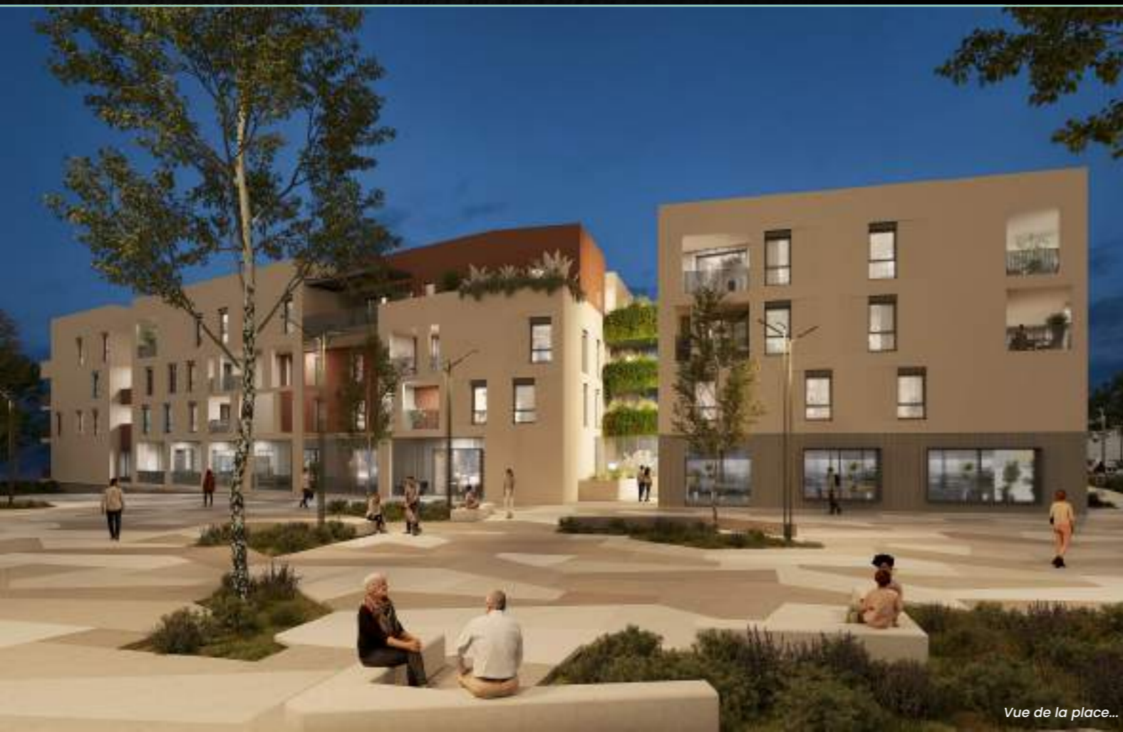
Vue de la place...

Des études de renouvellement urbain à l'acte de bâtir dans un monde en pleine mutation, l'expérience de ses collaborateurs lui offre une acuité d'analyse quant à la nature des divers enjeux de notre territoire. Cette précision lui permet d'agir en proximité avec les acteurs locaux pour définir les axes essentiels, dans l'objectif d'entreprendre dès à présent pour concevoir demain. Impliquée envers les entreprises qu'elle accompagne dans leur développement, ou vis-à-vis des habitants et de leur futur lieu de vie, L'Or Autrement s'engage à progresser en restant attentive à l'environnement tout en concevant d'agréables espaces où mobilités douces et activités économiques se mélangent, où des architectures sobres, novatrices et tournées vers l'amélioration de la qualité de vie des habitants susciteront un nouvel élan du patrimoine urbain.