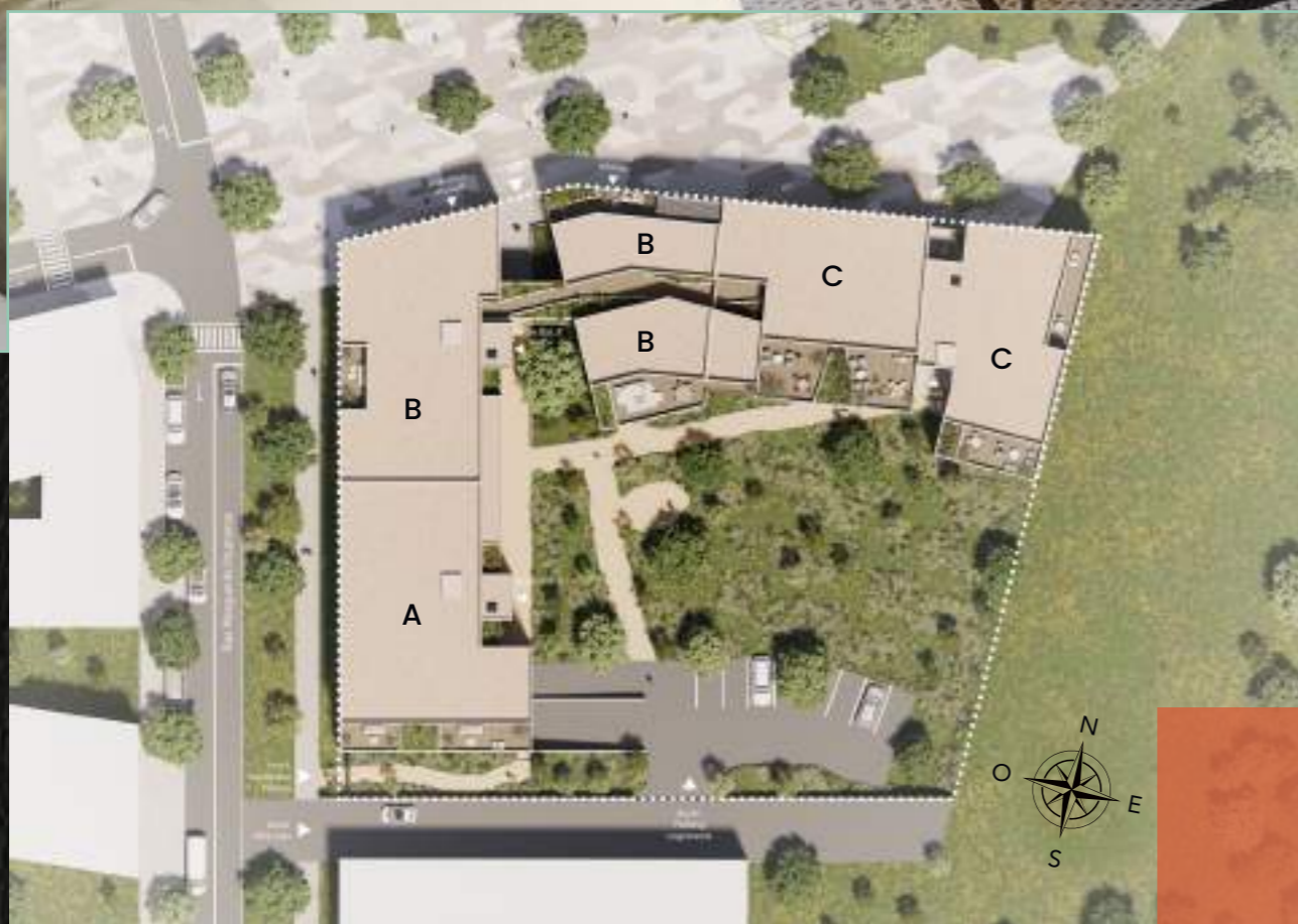
Plan de masse de l'ensemble résidentiel