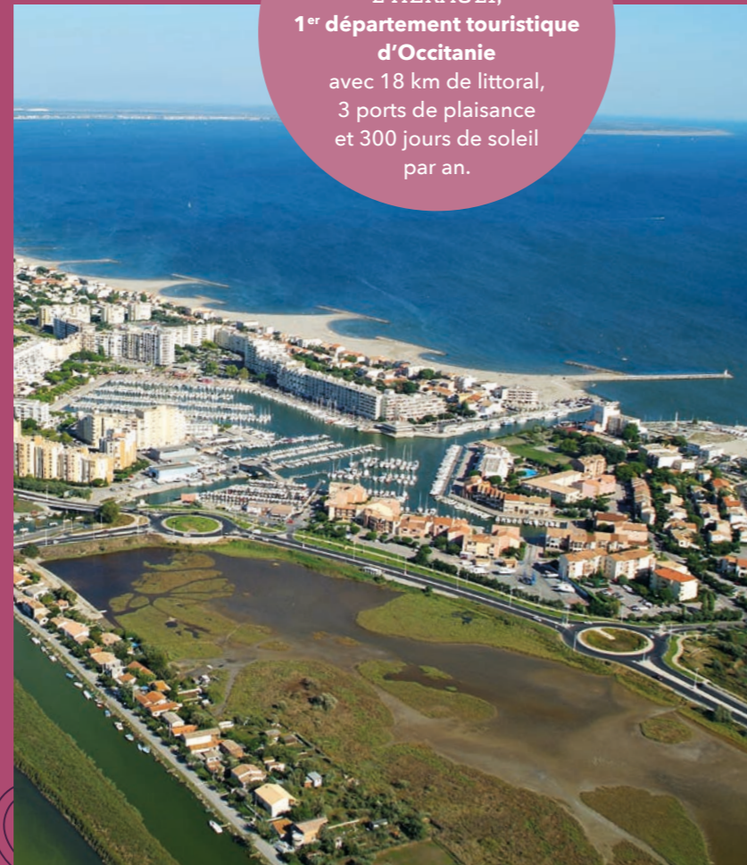
Le littoral et la station balnéaire de Carnon.

L'HÉRAULT, 1 er département touristique d'Occitanie avec 18 km de littoral, 3 ports de plaisance et 300 jours de soleil par an.