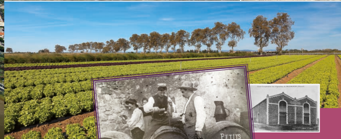
LA CAVE COOPÉRATIVE construite en 1920.