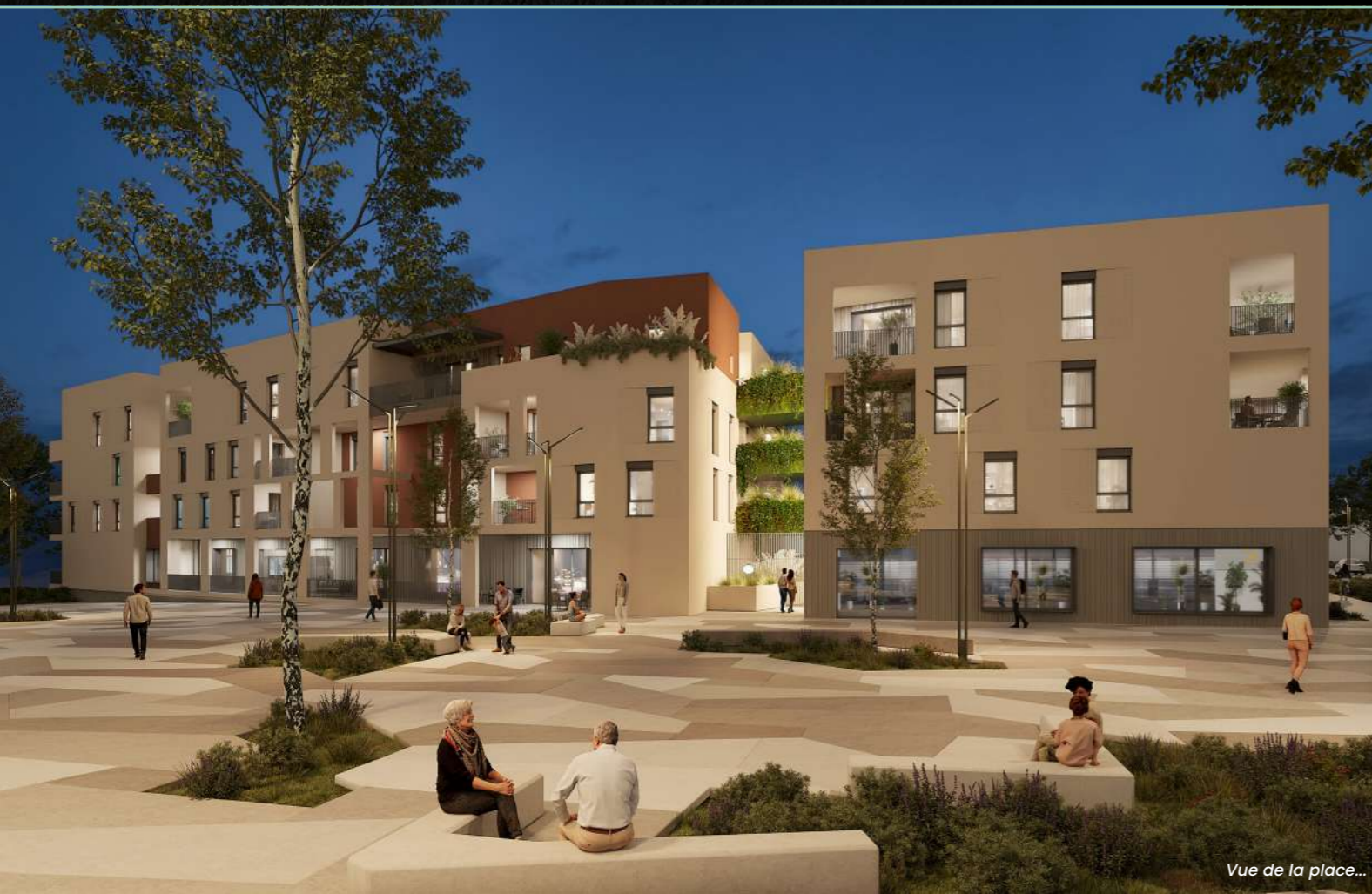
Vue de la place...

Des études de renouvellement urbain à l'acte de bâtir dans un monde en pleine mutation, l'expérience de ses collaborateurs lui offre une acuité d'analyse quant à la nature des divers enjeux de notre territoire. Cette précision lui permet d'agir en proximité avec les acteurs locaux pour définir les axes essentiels, dans l'objectif d'entreprendre dès à présent pour concevoir demain. Impliquée envers les entreprises qu'elle accompagne dans leur développement, ou vis-à-vis des habitants et de leur futur lieu de vie, L'Or Autrement s'engage à progresser en restant attentive à l'environnement tout en concevant d'agréables espaces où mobilités douces et activités économiques se mélangent, où des architectures sobres, novatrices et tournées vers l'amélioration de la qualité de vie des habitants susciteront un nouvel élan du patrimoine urbain.