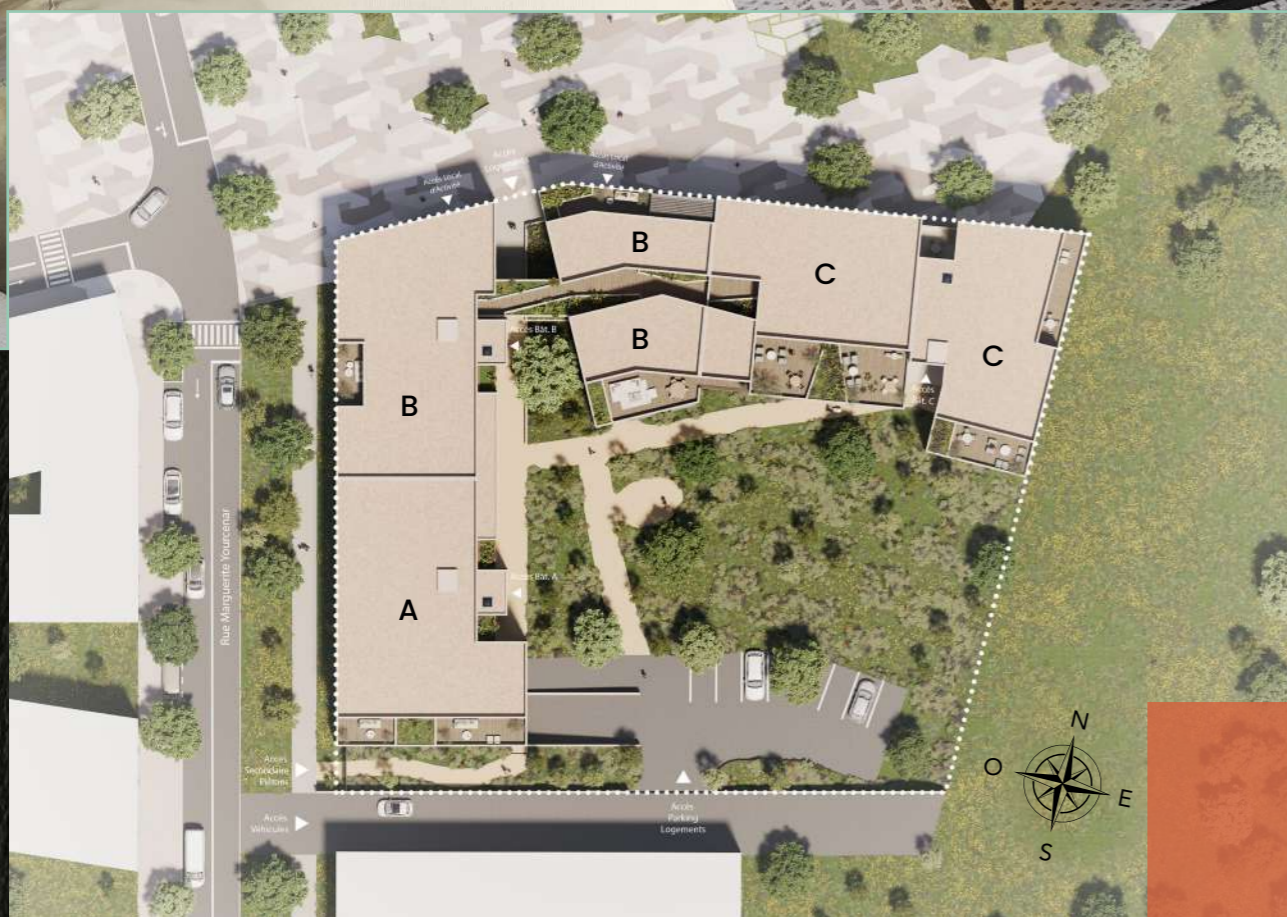
Plan de masse de l'ensemble résidentiel